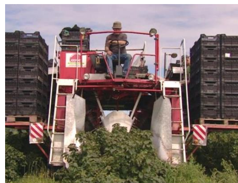
Het oogsten van zwarte bessen.

Na het stellen van vragen kreeg het gezelschap de gelegenheid om een rondgang te maken in de wijnmakerij en kreeg het nog aanvullende informatie.